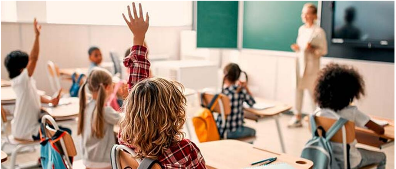
Schülerinnen und Schüler im Unterricht

Durch den andauernden Krieg in der Ukraine waren und sind viele Familien gezwungen, ihre Heimat zu verlassen. Im vergangenen Schuljahr 2023/2024 ist es den bayerischen Schulen gelungen, über 32.000 ukrainische Kinder, Jugendliche und junge Erwachsene erfolgreich ins Schulsystem zu integrieren.