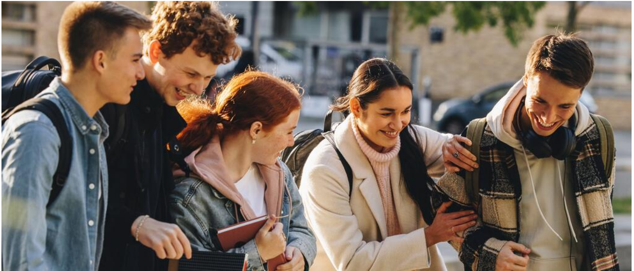
Das bayerische Gymnasium ist der direkte Weg zur Allgemeinen Hochschulreife