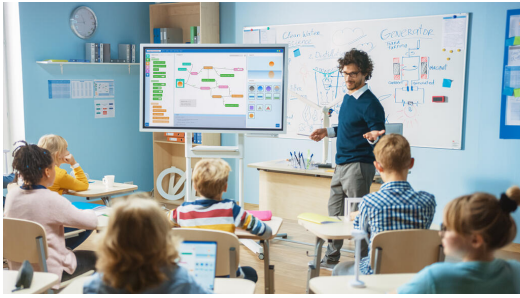
Digitale Klassenzimmer ermöglichen den gewinnbringenden und zeitgemäßen Einsatz elektronischer Medien und Werkzeuge im Unterricht

Bayern ist in der komfortablen Situation, im Gegensatz zu anderen Ländern bereits sehr früh in die Digitalisierung investiert zu haben. In den Förderprogrammen im Rahmen des → Masterplans BAYERN DIGITAL II