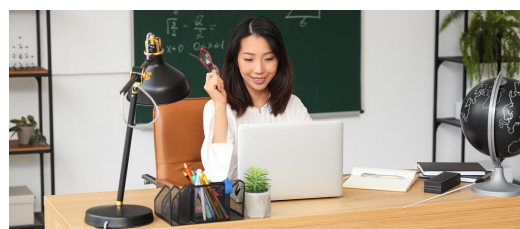
Die Ausstattung von Lehrkräften mit

Die Ausstattung der bayerischen Lehrerinnen und Lehrern mit schulischen digitalen Endgeräten leistet einen wichtigen Beitrag zur weiteren Professionalisierung des schulischen Arbeitens in Zeiten der Digitalisierung und schafft die Voraussetzung für eine rechtssichere Verarbeitung